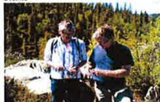
Jå, ja, tobakk og sluskehistoriar høyrer vel saman...