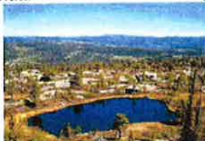
Utsyn frå Nipen